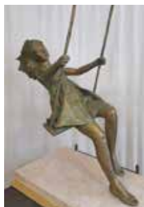
Tre sculture di Leonardo Lucchi